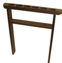
Juomateline / peitelautasarja Woody Lämpöpuu