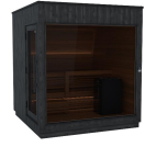
Kirami FinVision® -sauna M Nordic misty (Left), Harvia Virta Combi 10,8 kW